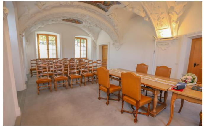
Trauungssaal, Erdgeschoss, Sitzplätze für 30 Gäste