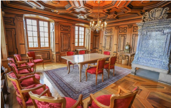
Trauungszimmer, Dachstock, Sitzplätze für 7 Gäste